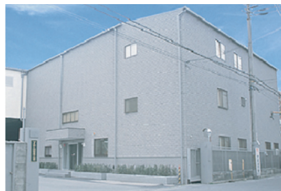
サイモト自転車株式会社